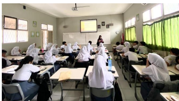
Gambar 5 Pelatihan Akuntansi Dasar