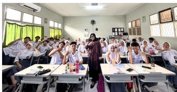
Gambar 6 Setelah Pelaksanaan Pengabdian Selesai