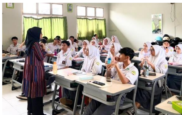
Gambar 4 Observasi dan Tanya Jawab dengan Siswa Siswi Sumber : Dokumentasi (2025)