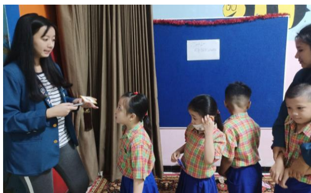
Gambar 5. Permainan Tebak Nama Sayur secara Bergiliran

depan dan bertugas untuk menunjukkan gambar kartu, lalu dua mahasiswa lainnya menjaga para siswa TK agar dapat bergiliran berbaris dengan rapi membentuk rangkaian kereta. Berbaris membentuk rangkaian kereta bertujuan agar setiap siswa memiliki kesempatan menjawab secara bergiliran tanpa menyela, serta membantu masing-masing siswa untuk belajar, tidak hanya mengikuti kata teman. Selain itu, barisan ini dibentuk rangkaian kereta dengan tujuan agar para siswa TK merasa semangat sekaligus penasaran ketika menunggu giliran siswa untuk menjawab, serta agar kegiatan tidak terkesan monoton dan efektif untuk memperkenalkan nama-nama sayur yang kurang familiar.