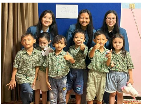
Gambar 1. Kunjungan Pertama dengan Para Siswa TK Rainbow Kiddy

Kegiatan pengabdian masyarakat yang dilakukan kelompok mahasiswa bertujuan untuk memberikan edukasi mengenai pentingnya mengetahui dan mempelajari prioritas kebutuhan sejak usia dini. Harapan dari kegiatan pengabdian masyarakat ini adalah para siswa dapat mulai membedakan mana saja yang menjadi kebutuhan maupun keinginan, yang dapat berdampak baik bagi masa depannya sehingga dapat menjadi mengurangi belanja-belanja yang hanya untuk memenuhi keinginan. Selain itu, hidup dengan memprioritaskan kebutuhan dapat membantu anak-anak TK untuk hidup lebih sehat baik secara jasmani maupun dalam keuangannya.