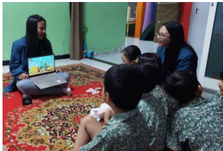
Gambar 3. Pemutaran Video Lagu Buah dan Sayur

pikiran dan emosi manusia (Yudianto, 2017). Setelah itu, para siswa ditampilkan powerpoint yang berisikan gambar-gambar buah dan sayur yang sudah ada dalam video sebelumnya. Untuk membangun interaksi, siswa TK Rainbow Kiddy diminta untuk menyebutkan nama dan rasa dari setiap gambar yang ada. Kemudian, para siswa dijelaskan mengenai manfaat buah dan sayur bagi kesehatan tubuh serta diminta membandingkan dengan makanan-makanan yang kurang bergizi. Pemutaran video mengenai buah dan sayur membantu para siswa untuk dapat memahami keputusan yang diambil yaitu memilih makanan yang sehat seperti buah dan sayur daripada makanan ringan ataupun makanan yang manis berlebih.