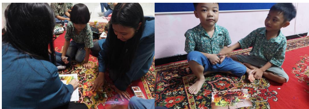
Gambar 8. Aktivitas Merakit Puzzle

masa usia dini, anak sangat senang dengan hal-hal yang baru. Anak kecil sering dan melakukan hal-hal yang rumit dan perlu penyelesaiannya dengan cara bekerjasama dengan teman ataupun orang dewasa (Marlina, 2018). Selama aktivitas ini berlangsung, para siswa menunjukkan tingkat keaktifan dan keantusiasan yang tinggi dalam menyusun puzzle tersebut agar menjadi sebuah gambar yang utuh. Aktivitas merangkai puzzle ini ditujukan untuk melatih kemampuan kognitif para siswa TK dalam menggabungkan warna, bentuk dan pola yang ada serta mengasah koordinasi mata dan tangan siswa dalam memegang, menyusun dan menempel potongan puzzle dengan tepat, serta memperhatikan detail-detail kecil yang terdapat dalam gambar tersebut. Dengan demikian, aktivitas juga bermanfaat untuk meningkatkan keterampilan kognitif dan motorik halus para siswa TK Rainbow Kiddy.