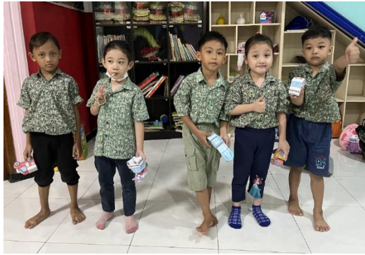
Gambar 6. Hasil Rakitan Mobil Siswa TK