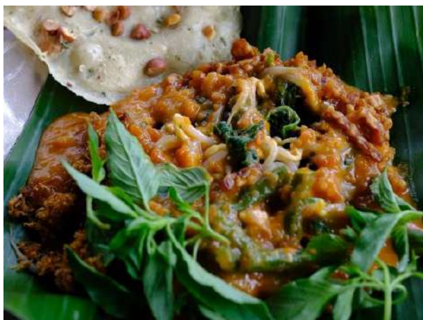
Gambar 2. Nasi Pecel Madiun

Berdasarkan wawancara dengan ketua paguyuban UMK Bumi Semending, saat ini pelaku UMK di Bumi Semending belum melakukan tertib administrasi pengelolaan keuangan secara rutin. Penghasilan setiap hari selalu berdasarkan perkiraan, sehingga pelaku UMK tidak mengetahui secara pastinya apakah hasil penjualan pelapak untung atau rugi. Selain itu, pelaku UMK juga tidak mengetahui bagaimana cara menetapkan harga pokok penjualan. Sebagian besar, pelaku UMK dalam menentukan harga pokok penjualan belum sesuai dengan pendekatan full cost , variable cost , atau pun activity based costing (Putri et al., 2021). Penetapan harga jual produk merupakan salah satu keputusan yang penting bagi pelaku usaha, dimana harga jual produk yang ditetapkan harus dapat menutup semua ongkos atau bahkan lebih dari itu agar supaya dapat menambahkan laba. Harga jual yang ditetapkan harus dapat bersaing dalam produk sejenis, sehingga tetap menyumbangkan contribution margin yang cukup untuk menutup biaya tetap dan menghasilkan laba usaha.