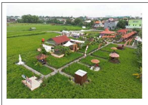
Gambar 1. Taman Wisata Bumi Semendung

Keberadaan lapak-lapak UMKM di kota Madiun diharapkan mampu mendongkrak perekonomian selama masa pandemi Covid-19. Salah satu lapak yang dibangun pemerintah Kota Madiun adalah Lapak UMKM Bumi Semendung, Lokasi lapak yang berada di taman wisata Bumi Semendung sangat estetik yaitu berada di tengah sawah menjadi daya tarik tersendiri bagi pengunjung dan hal ini menjadikan berkah tersendiri bagi para pelaku UMK di Bumi Semendung, kelurahan Klegen, Kecamatan Kartoharjo, Kota Madiun. Dari informasi lurah Klegen, Pemerintah Kota Madiun membangun objek wisata dan lapak tersebut untuk menarik wisatawan serta menumbuhkan perekonomian bagi warga setempat; dengan tambahan anggaran Rp 256 juta lebih untuk penyempurnaan lapak pada tahun 2022.