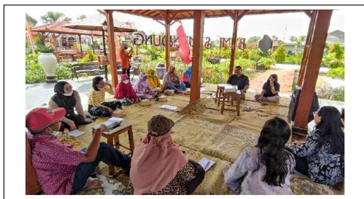
Gambar 6. Penyampaian Materi Pelatihan dan Tanya Jawab dengan Pelapak