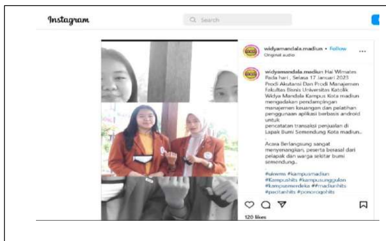
Gambar 7. Screen shoot IG (Publikasi Pelaksanaan PkM)

Tahap evaluasi dan pelaporan dilakukan setelah pelaksanaan pelatihan selesai. Editing video dan foto yang diambil oleh mahasiswa yang terlibat selama proses pelaksanaan pelatihan, dilakukan Lorensius Anang Setiyo Waloyo dan dipublikasikan melalui media sosial ( Instagram dan Facebook ).