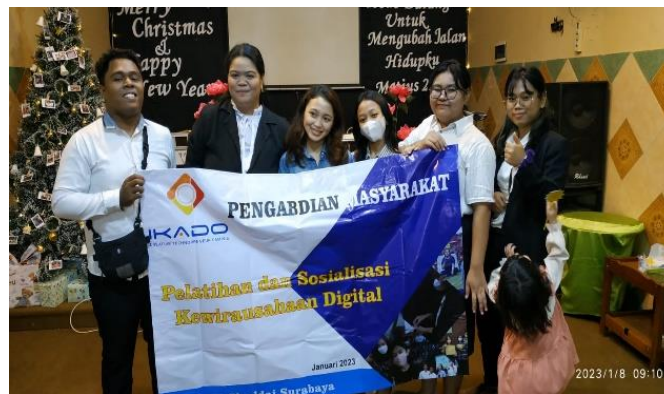
Gambar 5. Foto Bersama Perwakilan IKADO Surabaya dan Mitra Gereja El-Shaddai Surabaya

Pada tahapan evaluasi yang dilaksanakan di akhir acara di berikan sesi tanya jawab dan diskusi dari peserta, pada tahapan ini digunakan metode wawancara terhadap peserta, untuk mendapatkan masukan yang akan digunakan terhadap kegiatan selanjutnya, setelah sesi wawancara maka pada tahapan selanjutnya dilanjutkan dengan sesi foto bersama bersama perwakilan antara perwakilan dari Institut Informatika Indonesia dari mitra peserta pelatihan.