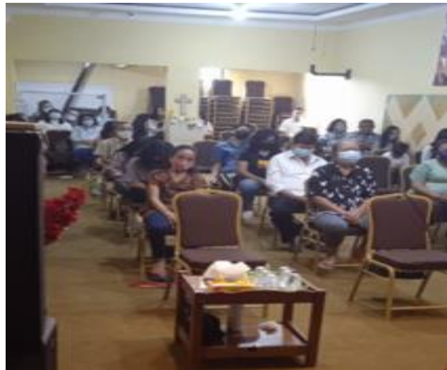
Gambar 3. Pemaparan Materi Pemasaran Digital

Pemasaran digital dianggap solusi bagi masyarakat era modern adalah karena rata-rata penduduk Indonesia telah memiliki ponsel pribadi, tercatat pada 2021 berdasarkan data dari wearesocial jumlah pengguna ponsel di Indonesia dan digunakan untuk mengakses internet adalah sejumlah 195,3 juta pengguna (Kemp, 2021). Pada pemasaran digital ini juga disampaikan mengenai konsep Society 5.0 dimana kombinasi antara manusia, informasi dilengkapi dengan infrastruktur teknologi terbaru dalam bisnis menjadi salah satu bentuk inovasi yang terus berkembang. Digitalisasi UMKM tidak hanya membutuhkan kreativitas dan inovasi saja namun perlu juga didukung oleh kebijakan dan pengambilan keputusan yang tepat, hal ini diperlukan agar UMKM memiliki keunggulan untuk dapat menembus pasar global dan memiliki dampak jangka panjang secara positif berkelanjutan dan akhirnya berkontribusi pada peningkatan ekonomi (Sugiono, 2020).