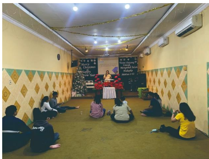
Gambar 2. Pemaparan Materi Dalam Kelompok Kecil

Pada materi pertama mengenai pelatihan kewirausahaan di lakukan dengan cara menyampaikan materi dalam bentuk slide power point dan membentuk kelompok-kelompok kecil yang terbagi dalam tiga sesi dengan maksud agar penyampaian materi yang diberikan dapat diterima dengan baik oleh peserta. Pemilihan power point sebagai media juga karena berdasarkan literatur dari (Osman et al., 2022) power point merupakan alat yang paling efektif dan atraktif dimana didalamnya dapat terjadi integrasi meliputi teks, grafik, animasi dan video. Pada sesi ini pemateri juga memberikan kesempatan kepada peserta untuk sharing atau membagikan kesulitan dan kendala mereka saat berusaha.