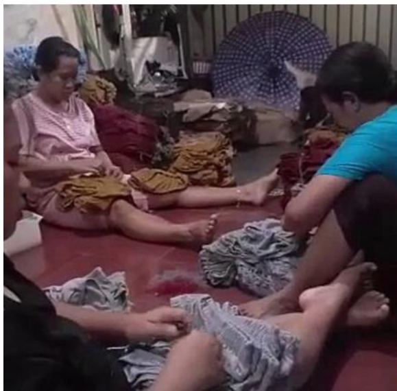
Gambar 4. Pendampingan Pelatihan Bagi Masyarakat

sederhana misalnya dari industri rumah tangga atau pasar kecil yang kemudian meningkat ke pasar yang lebih besar besar (perluasan pangsa pasar) hingga mampu menggeser pasar konvensional yang sudah ada sekaligus juga dapat merubah secara drastis proses bisnis dari sebuah organisasi/perusahaan. Maka dapat disimpulkan bahwa hal ini pun dapat menjadi hambatan dan tantangan jika pelaku UMKM tidak mampu menyesuaikan terhadap perubahan yang ada (Khairin et al., 2021).