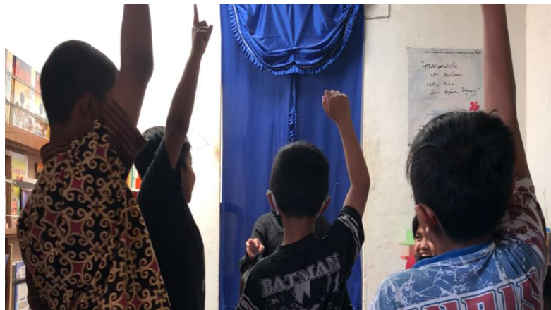
Gambar 3 Pengembangan kecerdasan bahasa melalui penyampaian ulang cerita dongeng

Dongeng juga dapat digunakan untuk meningkatkan emosi, merangsang imajinasi dan memperkuat kemampuan berpikir kritis anak. Dongeng umumnya memiliki fungsi positif dan mendidik (Habsari, 2017). Dongeng dirancang untuk mengendalikan emosi anak, memungkinkan imajinasi anak berkembang, dan anak dapat berpikir kritis. Mendongeng memiliki peranan penting untuk menciptakan karakter serta kepribadian pada anak, oleh karena itu terdapat amanat seperti semangat pantang menyerah, kerjasama, kesabaran, dan juga keikhlasan yang ada pada dalam dongeng diteladani dengan mudah oleh anak. Hal tersebut merespon saraf otak dalam membentuk kepribadian anak kedepannya (Umar, 2020). Karakter sangat identik dengan budi pekerti. Hal itu didefinisikan yang berarti perangai (akhlak), kemampuan menimbang sesuatu yang baik atau buruk dan benar atau salah. Sifat manusia membedakan satu pribadi seseorang terhadap orang lain atau dari suatu bangsa terhadap bangsa lain (Nurchasanah, 2013). Pendidikan karakter merupakan salah satu soft skill , selain itu, Ditjen Kemendikbud menjelaskan bahwa karakter adalah cara berpikir dan berperilaku yang khas dari setiap individu untuk hidup dan bekerja sama dalam keluarga, masyarakat, bangsa dan negara. . Orang yang berkarakter baik adalah orang yang dapat mengambil keputusan dan bersedia memikul tanggung jawab atas akibat dari keputusannya (Habsari, 2017).