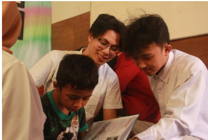
Gambar 2 Praktik kegiatan berliterasi

memberikan pelajaran bermakna (amanat) dan menumbuhkan nilai baru pada anak. Selain memiliki sifat imajinatif dongeng juga berfungsi sebagai hiburan yang menghasilkan nilai moral (Wahyuni, 2017).