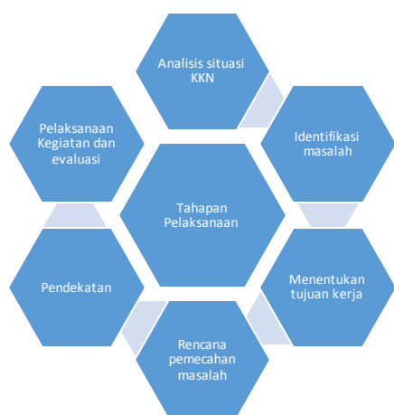
Gambar 1. Tahapan KKN.

Tahapan – tahapan yang akan dilakukan dalam implementasi model aplikasi UML ini meliputi :